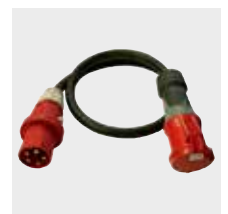
Heizung 400 Volt Verlängerungskabel.