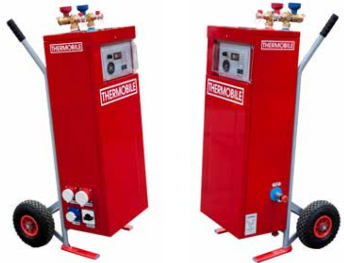
TMB 19/20/40 (F)