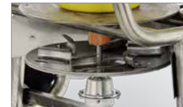
Streuscheibe in Edelstahl, einstellbar