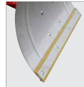
auswechselbare Edelstahlschürfleiste oder PU-Flüsterleiste (Zubehör)