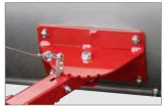
Steuerung für drei/fünf Schildpositionen