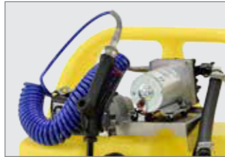
Spiralschlauch, Elektropumpe und Akku mit Ladegerät