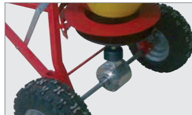
robustes Getriebe mit Aluminiumgehäuse