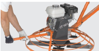
TRANSPORT DER MASCHINE