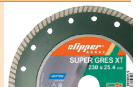
Im Lieferumfang: Clipper SUPER GRES XT Ø230x25,4 mm Diamantscheibe