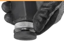
Bessere Stabilität durch neue Standfüße

Fliesenschneidmaschine für den Profi mit kraftvollem Motor (1,1 kW) und einer Schnittlänge von bis zu 1200 mm. Vibrationen werden durch den Schneidtable mit Antirutschauflage und zusätzliche Befestigungsklammern reduziert. Inklusive verstärktem Rahmen und verbesserten Standfüßen.