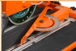
Tisch mit Antirutschbeschichtung / Winkelschnittführung