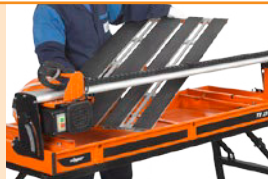
Einfaches Entfernen des Auflagetisches