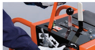
MANUELLER ODER HANDHYDRAULISCHER VORSCHUB.