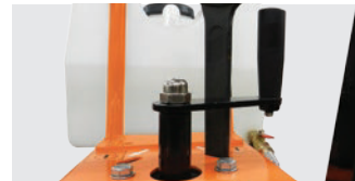
SCHNITTIEFENEINSTELLUNG PER HANDRAD

WIR EMPFEHLEN DEN EINSATZ FOLGENDER DIAMANTSCHLEIBE FÜR CS401