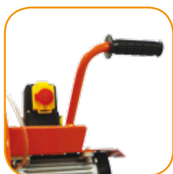
Verlängerter und anwenderfreundlicher Handgriff.