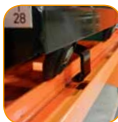
Aussparungen zur leichten Entnahme des Schneidisches.