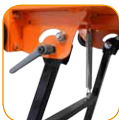
Klappbare und feststellbare FüÙe.